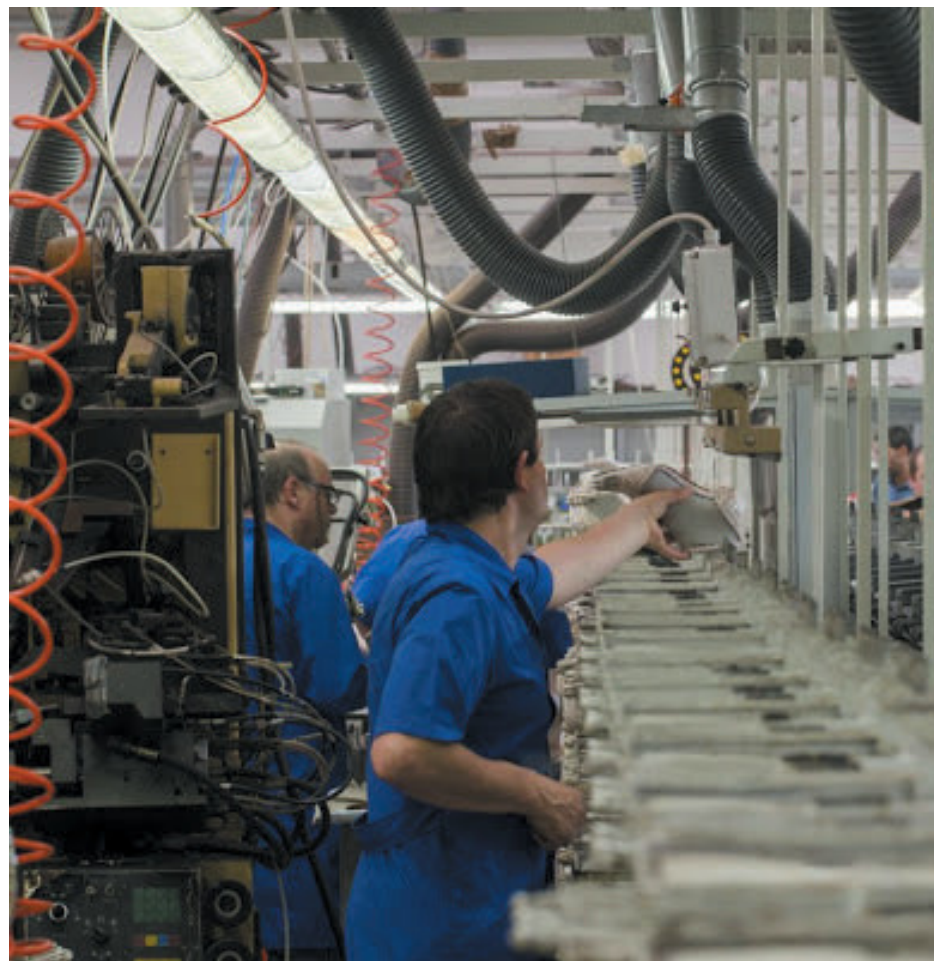
Storia dell'azienda Uniform di Brugato (La Spezia)